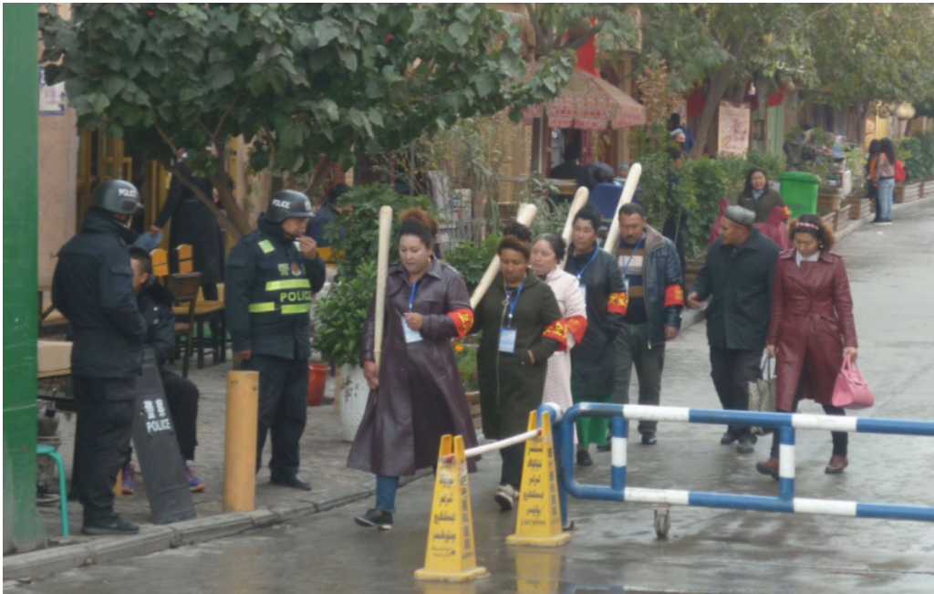
مشهد منتشر في شوارع شينجيانغ # هذه الأيام. الرجال والنساء (بما في ذلك كبار السن) يتجولون بأندية ضخمة ، وهي جزء من "حرب الشعب" على الإرهاب