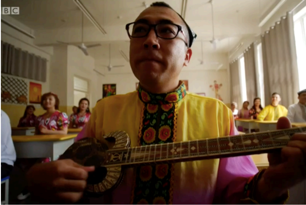
مشهد من جولة على "مركز التدريب المهني". يعزف محتجزو الأويغور الموسيقى لإظهار "الانسجا" و"السعادة" داخل المخيمات.

وبالتالي ، من السخف حقاً فهم قضية استعمار الأويغور من خلال عدسة السياسة الصينية الأمريكية. بدأ استعمار تركستان الشرقية قبل وقت طويل من أن تصبح الصين منافساً حقيقياً في سعيها للهيمنة الاقتصادية الدولية وستستمر لفترة طويلة بعد أن تغير الولايات المتحدة أو الصين سياستها الخارجية .