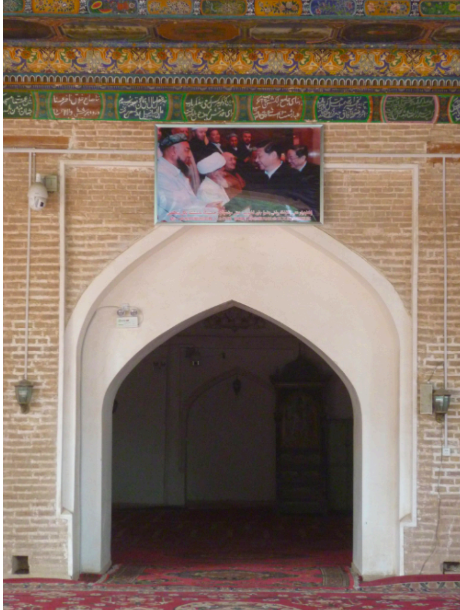
صورة الرئيس الصيني شي جين بينغ يصافح الأئمة الأويغور الموضوعة في مسجد عيد كاش التاريخي قاشغرفي تركستان الشرقية. علما أن الصورة في اتجاه صلاة المسلمين – القبلة

إن ممارسة الإسلام محظور بشكل قاطع في تركستان الشرقية ، على الرغم من الضمان الدستوري الصيني لحرية الدين. تحظر النصوص والأسماء الإسلامية ، ويُحظر ممارسة أركان الإسلام الخمسة ، وقد تم تدمير المؤسسات الإسلامية القديمة وتحويلها إلى مراكز دعائية شيوعية. اختفى علماء الدين ، أو حُكم عليهم بالسجن المؤبد أو قتلوا.